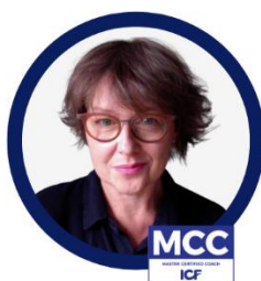
Jadoga Inglik Coach, Trenerka, Mentorka